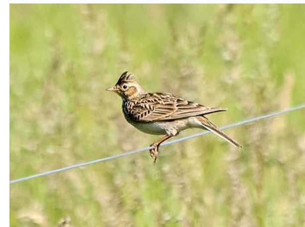
Vogel des Jahres 2019 „Die Feldlerche“